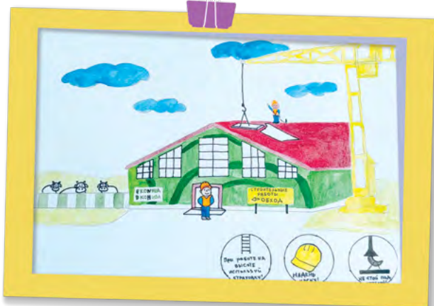
Пётр Харин, 4 года