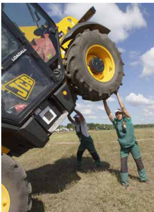
Отличная поддержка! Инженеры готовы носить погрузчики JCB на руках!