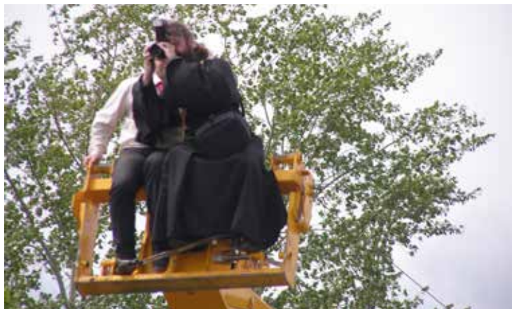
Ну, с Богом! JCB встречает крестный ход в Курской области