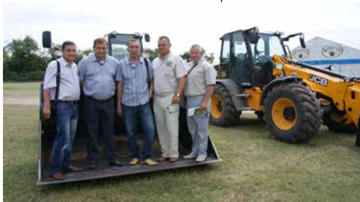
Вместительный, однако! На Дне поля в Германии