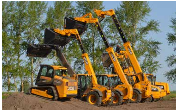
От мала до велика Семейство JCB готово к работе!