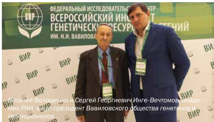
Виталий Волощенко и Сергей Георгиевич Инге-Вечтомов, академик РАН, вице-президент Вавиловского общества генетиков и селекционеров

– Мы надеемся, что помимо фундаментальных целей у всемирно известной вавиловской коллекции будут еще и