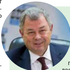
Анатолий Артамонов, губернатор Калужской области

От души поздравляю с юбилеем коллектив «ЭкоНивы». Хорошо помню, как компания делала свои первые шаги, и наше первое знакомство со Штефаном Дюрром. Тогда и представить было невозможно, что его инициатива вырастет в такое масштабное производство. За эти годы «ЭкоНива» дала работу жителям Калужской области, а это 1,5 тысячи рабочих мест на высокотехнологичных животноводческих комплексах. Желаю всему коллективу крепкого здоровья и новых побед.