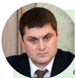
Ильшат Фазрахманов, заместитель премьер-министра Республики Башкортостан, министр сельского хозяйства Республики Башкортостан